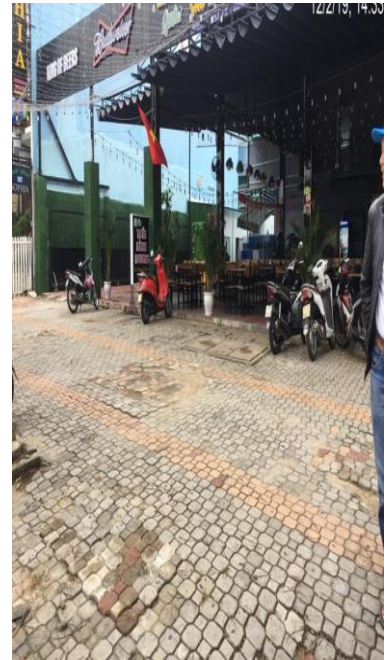
Hình ảnh trước và sau xử lý tại vị trí 535 Nguyễn Tất Thành