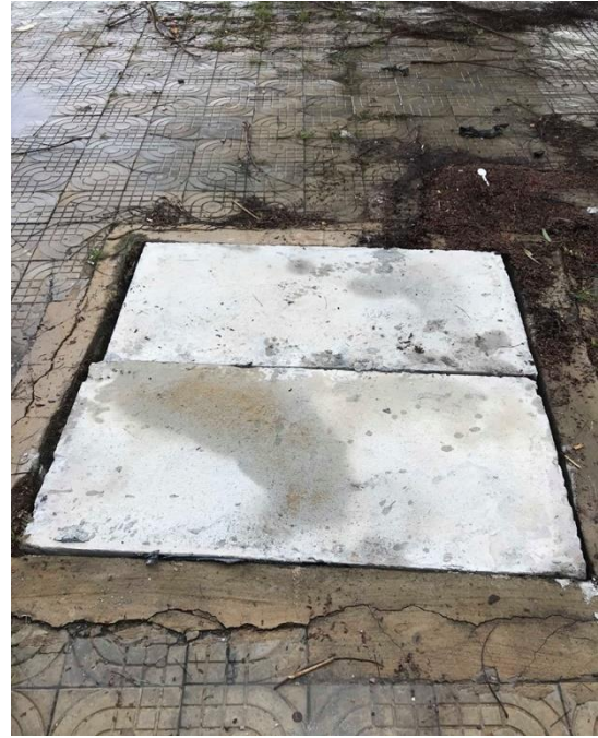
Hình ảnh trước và sau xử lý tại vị trí hư hỏng trên đường Hồ Hán Thương