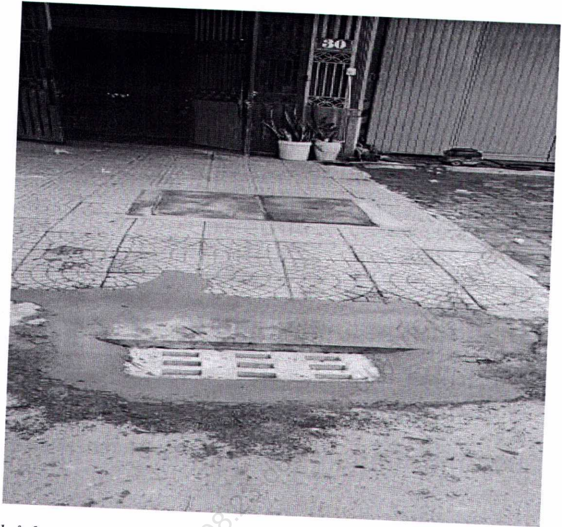
Hình ảnh sau xử lý tại vị trí cửa thu nước bị vỡ trước SN 30 Nguyễn Phước Tấn