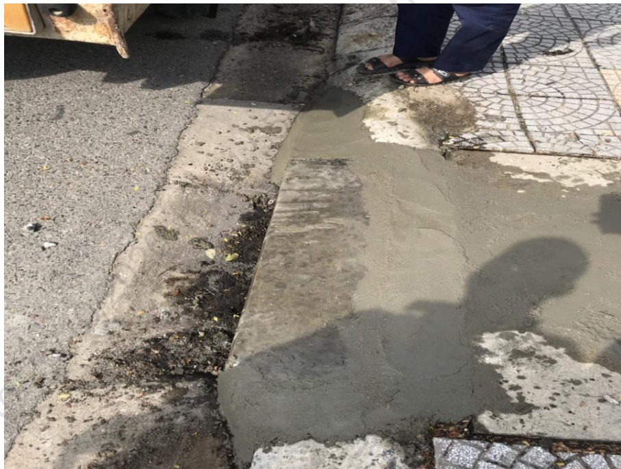
Hình ảnh sau sửa chữa vị trí hư hỏng trước số nhà 44 Nguyễn Văn Linh