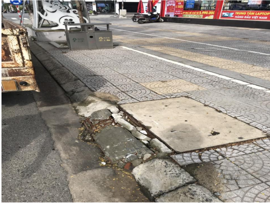
Hình ảnh trước xử lý trước số nhà 44 đường Nguyễn Văn Linh