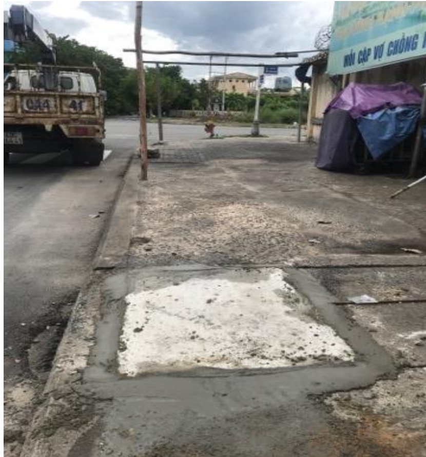
Hình ảnh sau xử lý tại vị trí hư hỏng trên vỉa hè đường Lý Đạo Thành