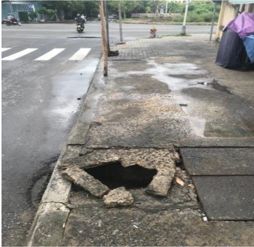
Hình ảnh trước xử lý tại vị trí hư hỏng trên vỉa hè đường Lý Đạo Thành