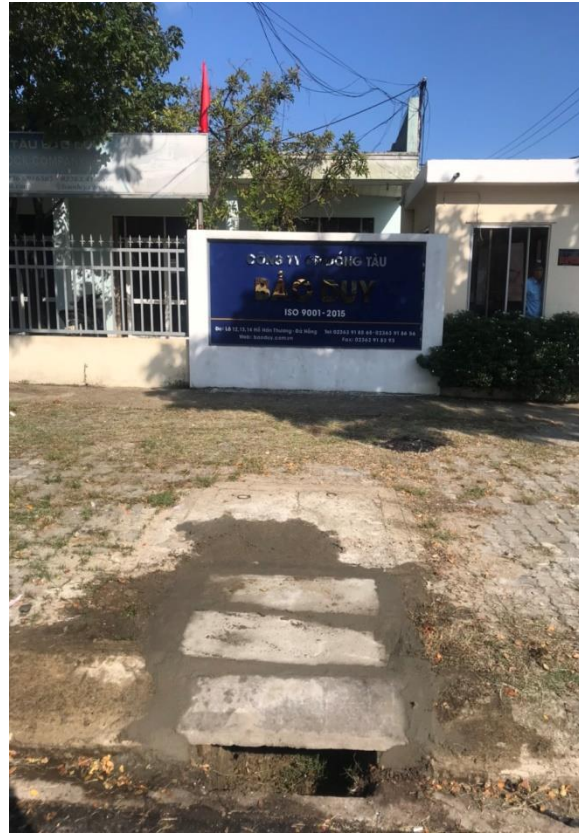
Hình ảnh trước và sau xử lý các vị trí hố ga bị mất trên đường Hồ Hán Thương