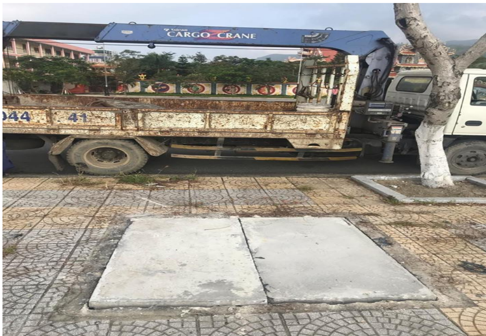
Hình ảnh sau xử lý đạn vỡ trên đường Hoàng Sa