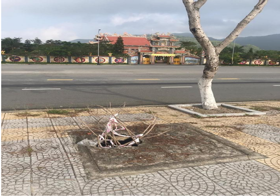
Hình ảnh trước xử lý đạn vỡ trên đường Hoàng Sa