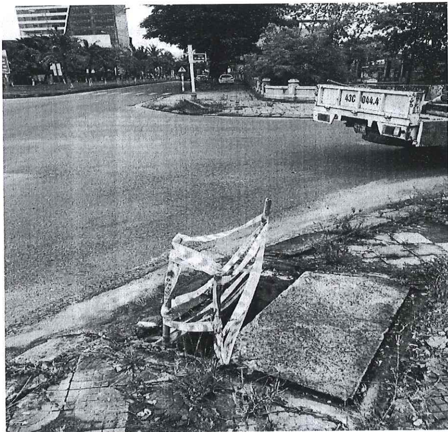
Hình ảnh trước xử lý tấm đan bị mất tại ngã tư Nguyễn Tất Thành -Đàm Quang Trung