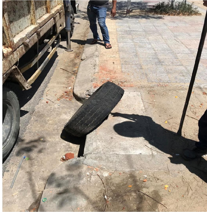
Hình ảnh trước xử lý vết nứt mặt ảnh ga b v trên đường Hoàng Th Loan