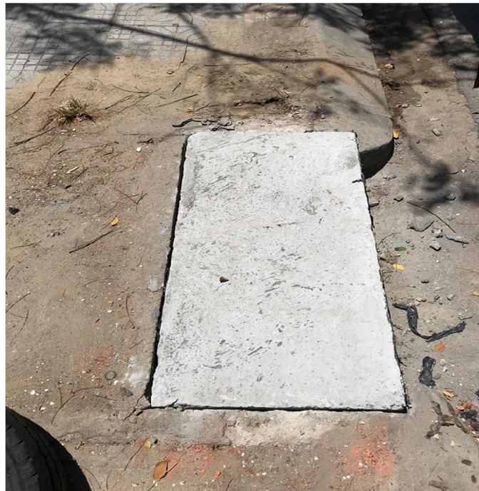
Hình ảnh sau xử lý vết nứt mặt ảnh ga b v trên đường Hoàng Th Loan