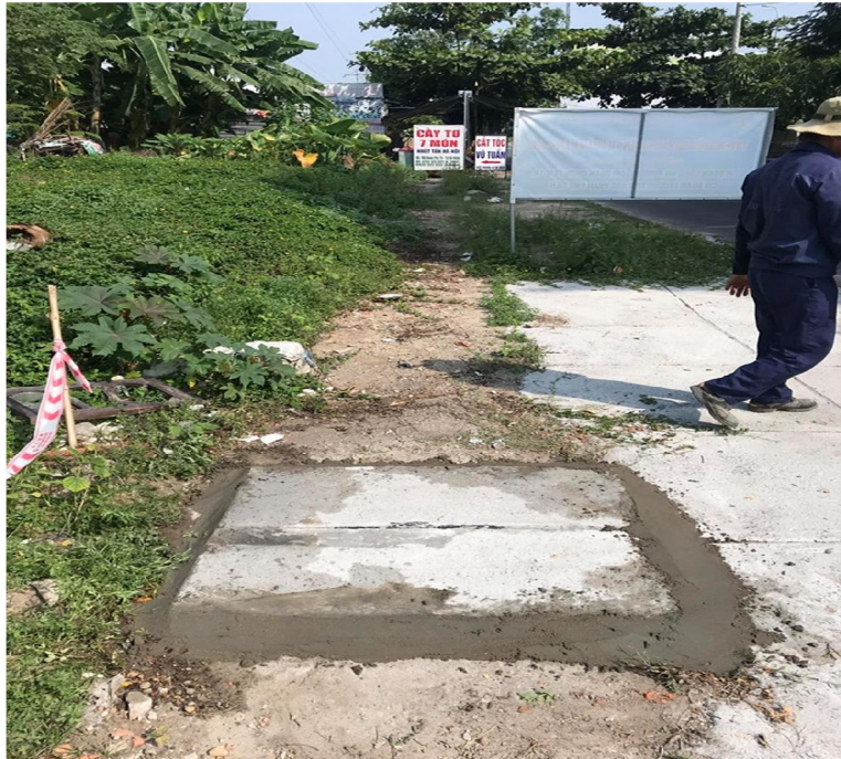
Hình ảnh sau x lý thi công hầm trên đường thôn Phú T