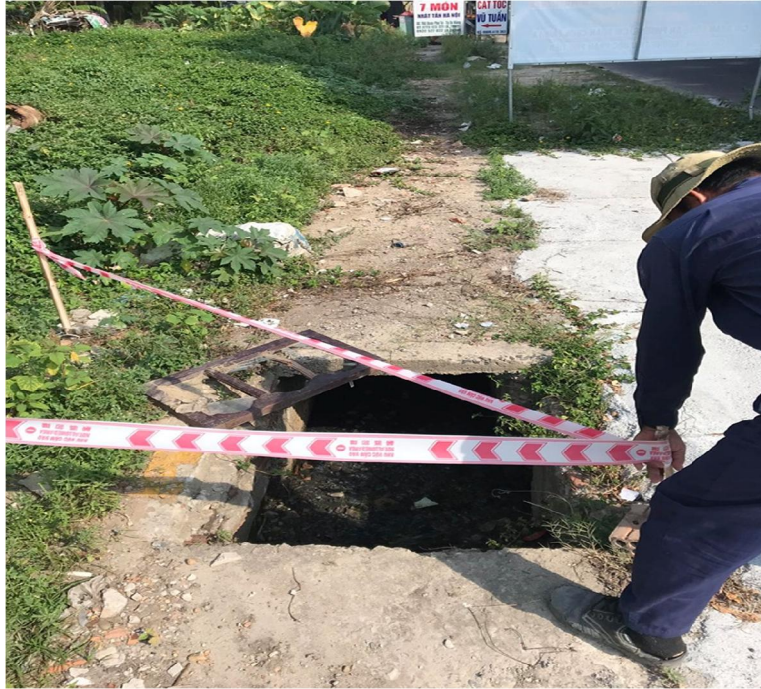
Hình ảnh trước x lý thi công hầm trên đường thôn Phú T