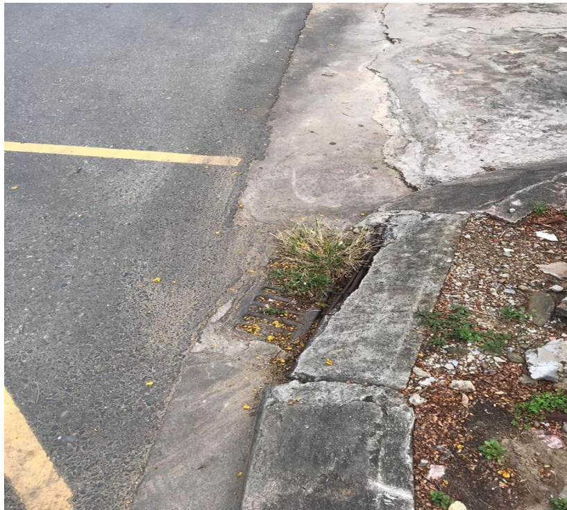
Hình ảnh trước xử lý tại vị trí đan thoát nước bị vỡ đường Dũng Sĩ Thanh Khê