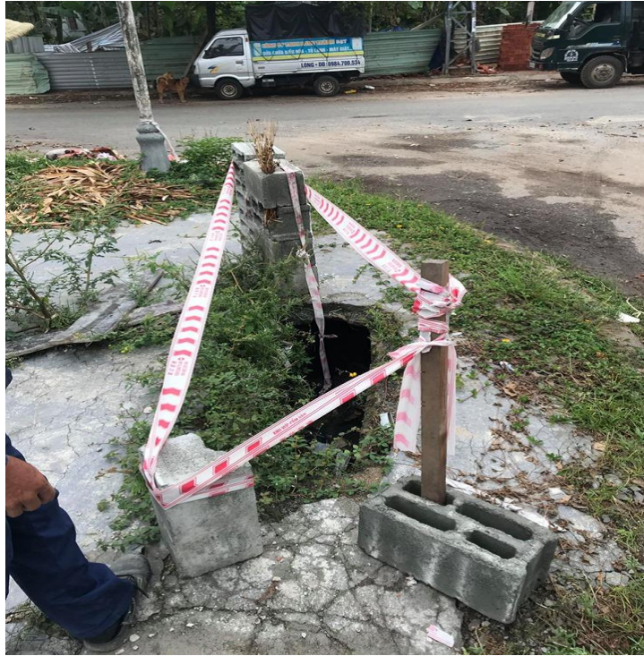
Hình ảnh trước xử lý tại hố ga mất nắp trên đường Lê A