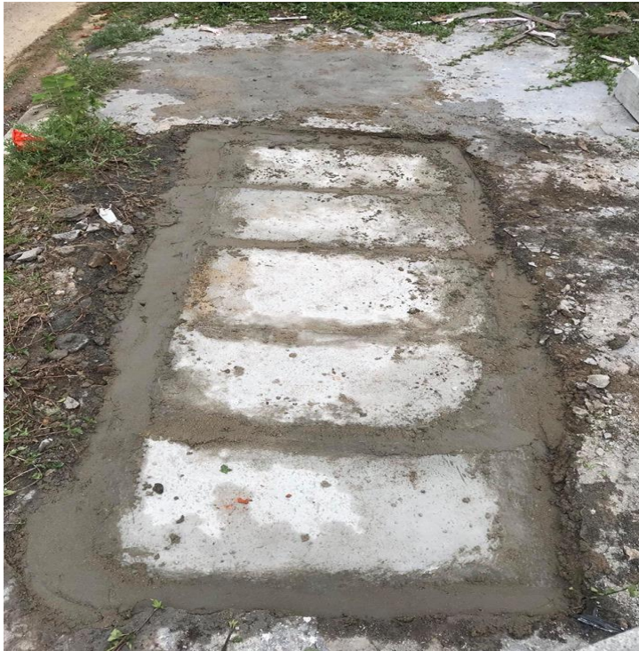
Hình ảnh sau xử lý tại hố ga mất nắp trên đường Lê A