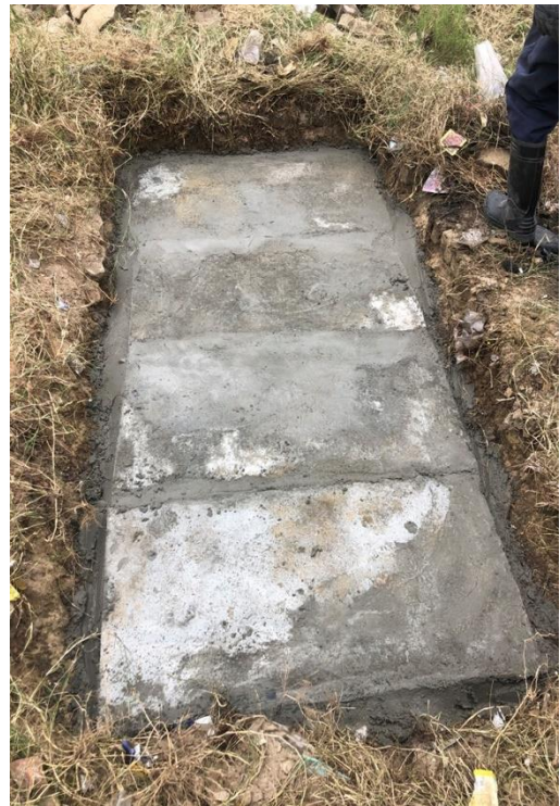
Hình ảnh sau xử lý tại vị trí gây tắc nghẽn trước chung cư nhà B, đường Khúc Thừa Dụ