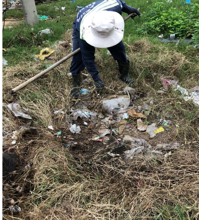
Hình ảnh trước xử lý tại vị trí gây tắc nghẽn trước chung cư nhà B, đường Khúc Thừa Dụ